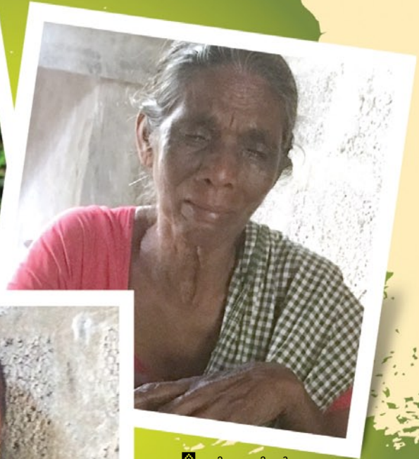
സിന്ധുവിന്റെ അമ്മ സരസ്വതി